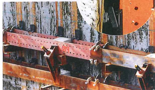
▲HS型裏込めブロック使用現場